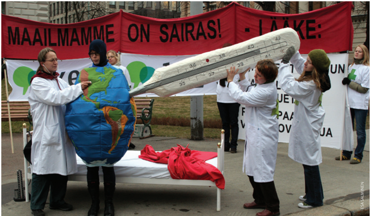
Hallitusneuvottelutempaus Säädytalon edessä huhtikuussa 2007.