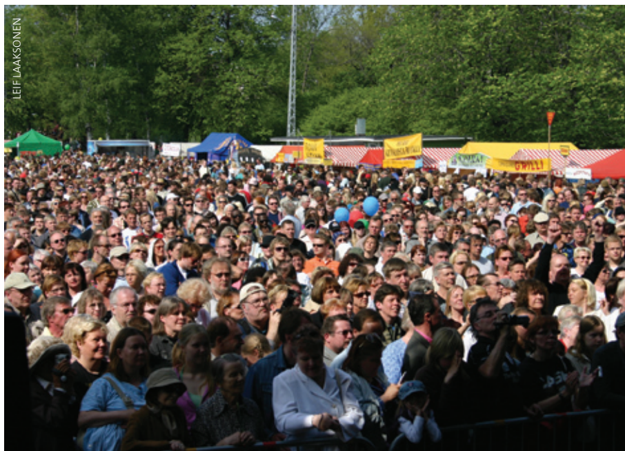
Kari Tapio keräsi ennätysyleisön.