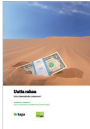
Lisätietoja Kepan raportista: Uutta rahaa – Miten ilmasto-lasku maksetaan? www.kepa.fi/