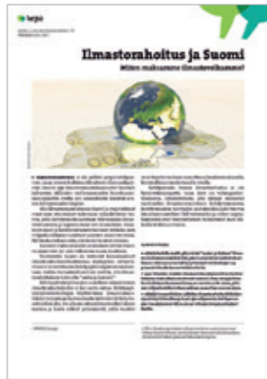
Lisätietoja Kepan ajankohtaiskatsauksesta: Ilmastonhoito ja Suomi . www.kepa.fi/post2015

YK:n ilmastoneuvotteluita käydään uuden kehitysohjelman luomisen rinnalla. Vuosi 2015 ratkaisee niiden tuloksen. Uudessa kehitysohjelmassa ympäristökysymykset, talous ja sosiaalinen kehitys nivotaan yhteen. ◀