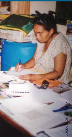
JUKKA ARONEN / KEPA