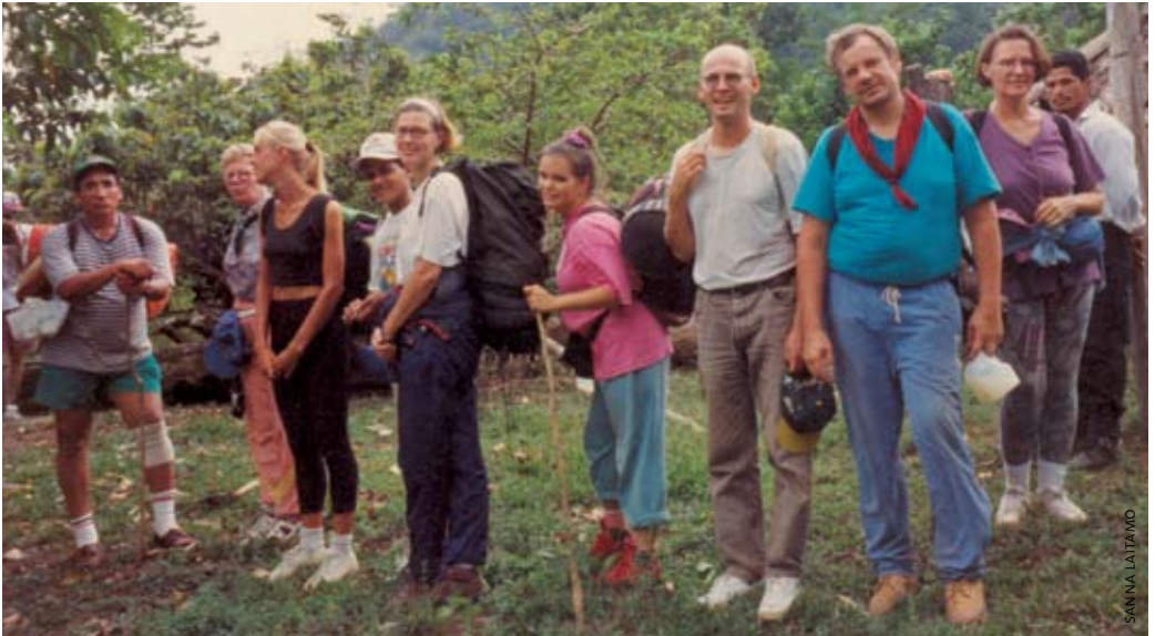
Ryhmä kehitysjoukkolaisia tutustumassa Bosawasin sademetsäalueeseen