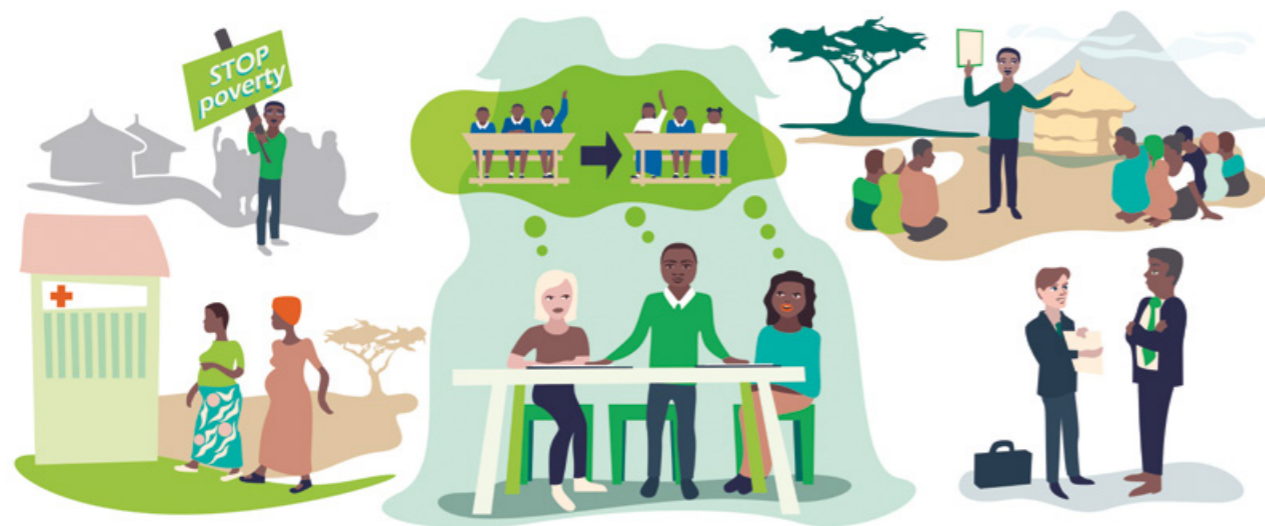
Kuvitus: Pirita Toivanen

Seuraavien sivujen esimerkit kertovat, miten maailmanlaajuisiin kehityshaasteisiin puututaan suomalaisjärjestöjen ja paikallisten kumppanien yhteisillä ponnistuksilla.