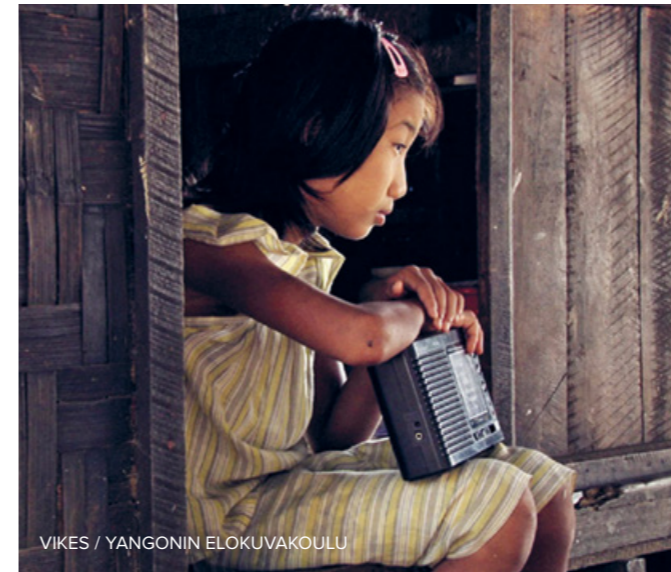
VIKES / YANGONIN ELOKUVAKOULU