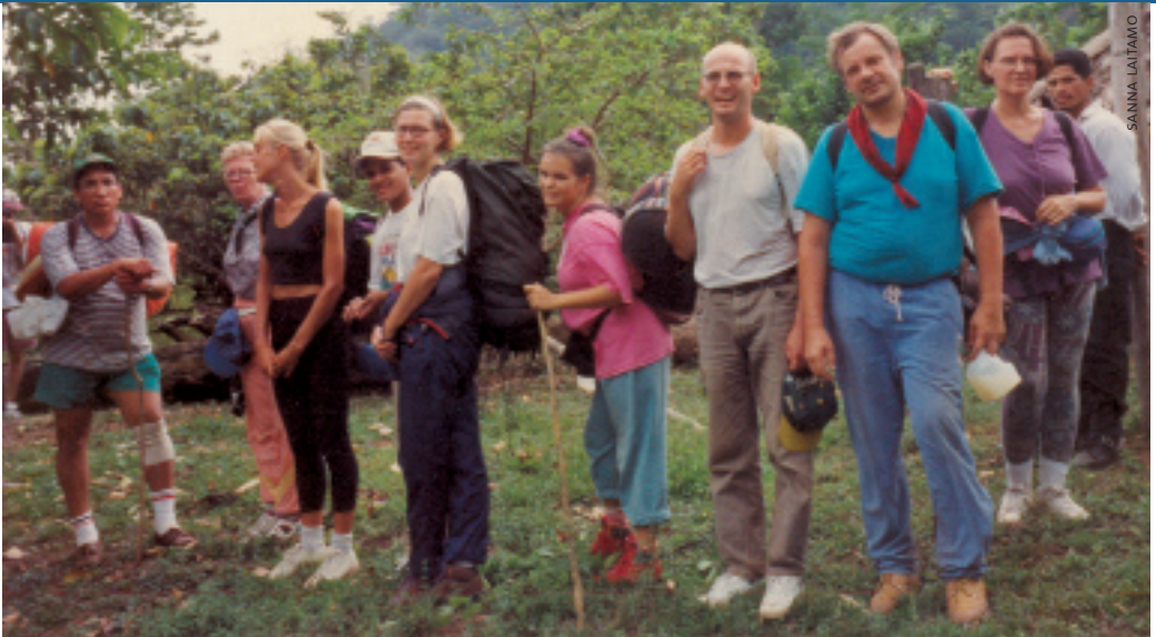
Un grupo de cooperantes visita Bosawas