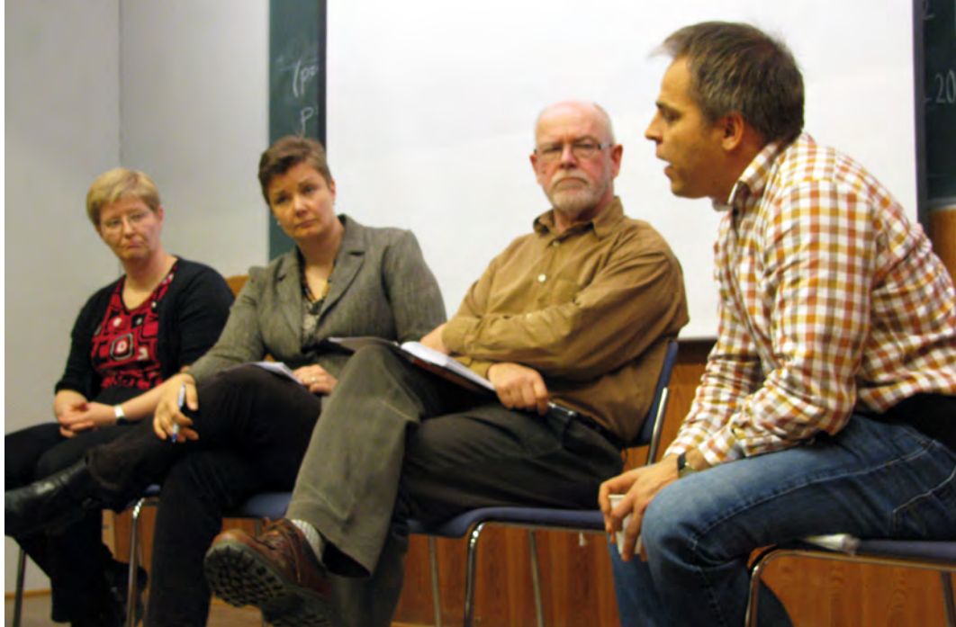
Kehyksen tilaisuuksissa on pureuduttu myös kasvun problematiikkaan ja hyvinvoinnin mittaamiseen. Kuva Suomen Sosiaalifoorumista 2012.