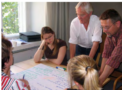
Työryhmätyöskentelyä vuoden 2006 kansainvälisyyskasvatuskonferenssissa.