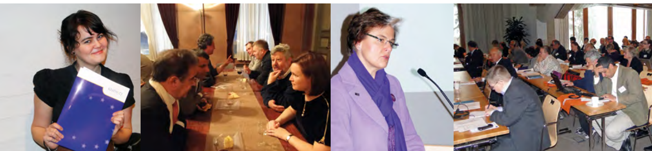
Välimeri-Itämeri -hankkeen loppuseminaarin tunnelmia vuonna 2011.

”Alussa Kehys oli isoveli nuorelle järjestöllemme, nyt voidaan puhua jo kumppanuudesta. Yhteistyö on kehittynyt ja molemmilla järjestöillä on enemmän tarjottavaa toisilleen. Samalla vastuuta on pystytty jakamaan.”