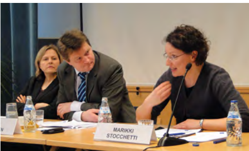
EU:n ulkosuhdehallinnon muotoutumista pohdittiin seminaarissa 2011.

KATU-verkoston ja Kehyksen käynnistämässä turvallisuus ja kehitys -työryhmässä on purettu vuosien saatossa asekaupan ongelmiin sekä EU:n ja Suomen linjauksiin rauhankäytöstä ja kokonaisvaltaisesta kriisinhallinnasta, hauraiden valtioiden asemasta, humanitaarisen avun ja kehitysyhteistyön suhteesta sekä turvallisuus- ja puolustuspolitiikasta. Työryhmä on myös seurannut Euroopan ulkosuhdehallinnon muotoutumista.