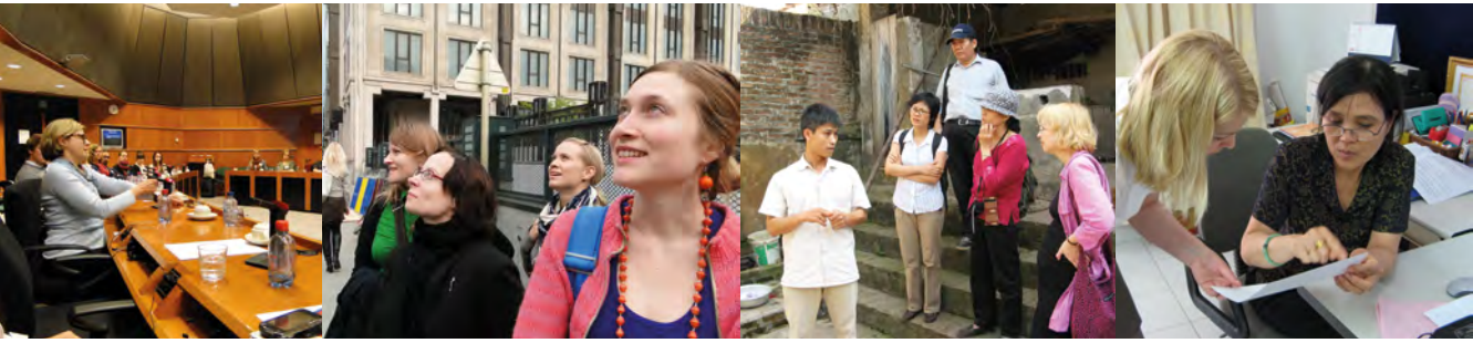
Tunnelmia Kehyksen Brysselin, Vietnamin ja Etiopian järjestömatkoilta.