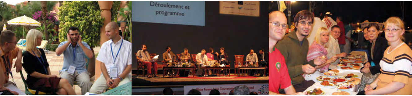
Euromed-kansalaisyhteiskuntafoorumi kokosi järjestökenttää Marokon Marrakeshiin 2006.