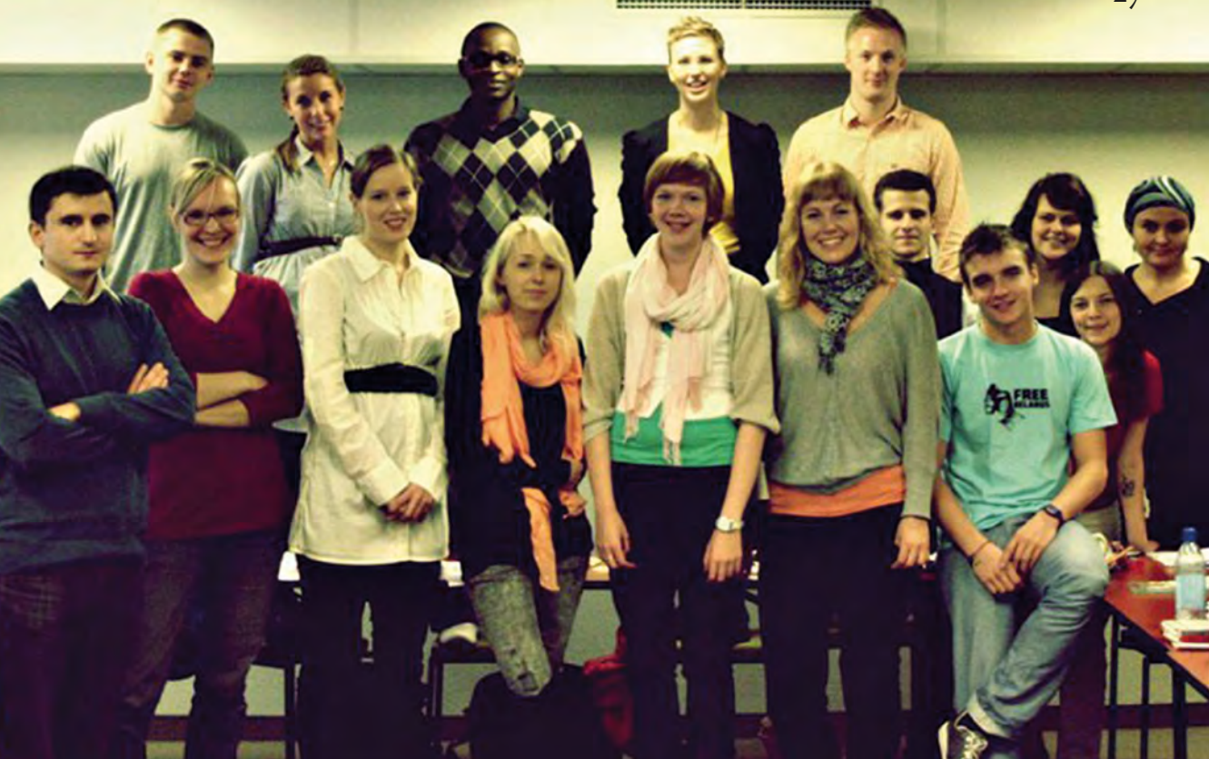
Future Global Leaders -hankkeeseen osallistui nuoria Suomesta ja Virosta

Australiasta ja Latinalaisesta Amerikasta. Kesäkoulun teemaa, laatua ja vaikuttavuutta, käsiteltiin yhteisissä teemasessioissa ja työryhmissä, joissa pureuduttiin vaikuttamistyöhön ja kampanjointiin, aikuiskasvatukseen, nuorisokasvatukseen ja kansainvälisyyskasvatuksen resursseihin.