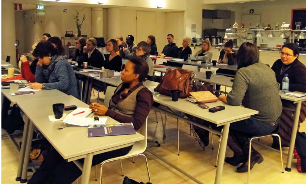
Future Global Leaders –hankkeen loppuseminaari 2011.

gian julkistamistilaisuuden jälkeen Lissabonissa marraskuussa 2007.