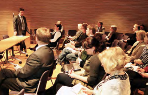
Ympäristöministeri Ville Niinistö Kehyksen ruokaturvaseminaarissa 2012.