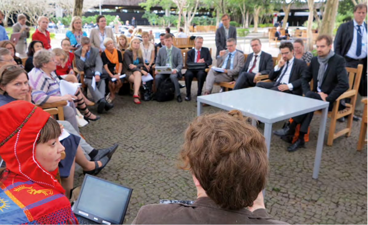
Suomalaisten poliitikot ja järjestöedustajat tapasivat Rion kestävän kehityksen konferenssissa 2012.

sopeutumiseksi sekä läpinäkyvyyttä ilmastorahoitukseen.