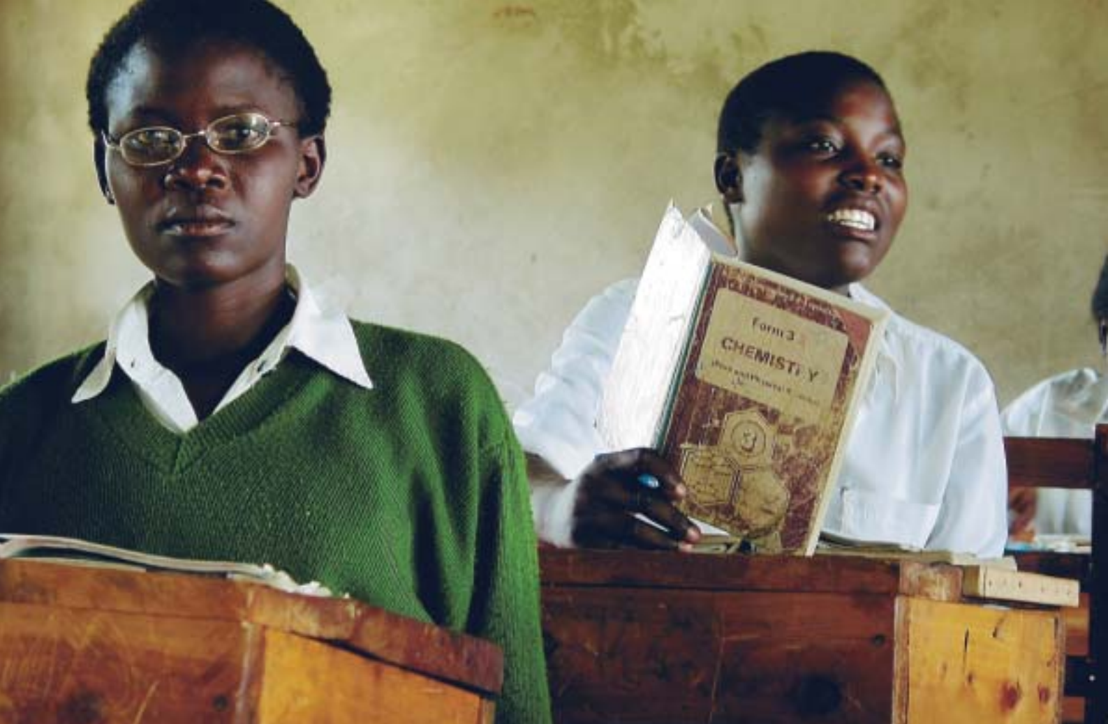
SIRISIAN TYTTÖKOULUN OPPILAITA KEMIAN TUNNILLA.