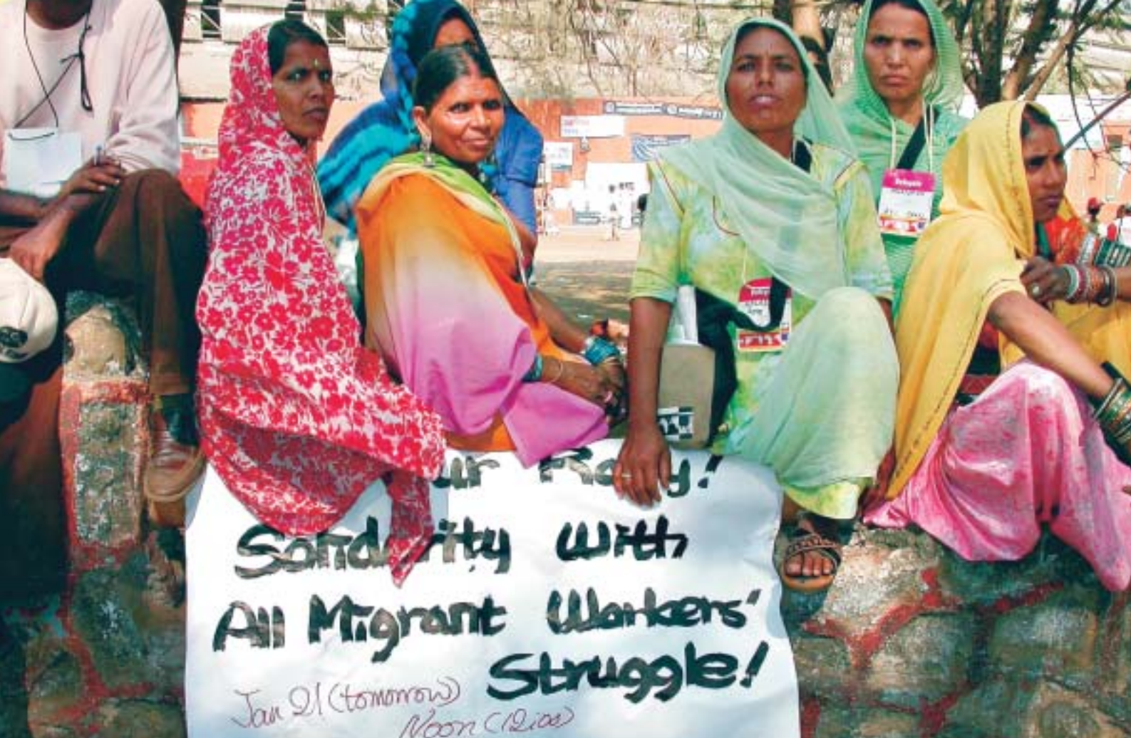
SIIRTOLAISNAISIA MUMBAIN SOSIAALIFOORUMISSA.