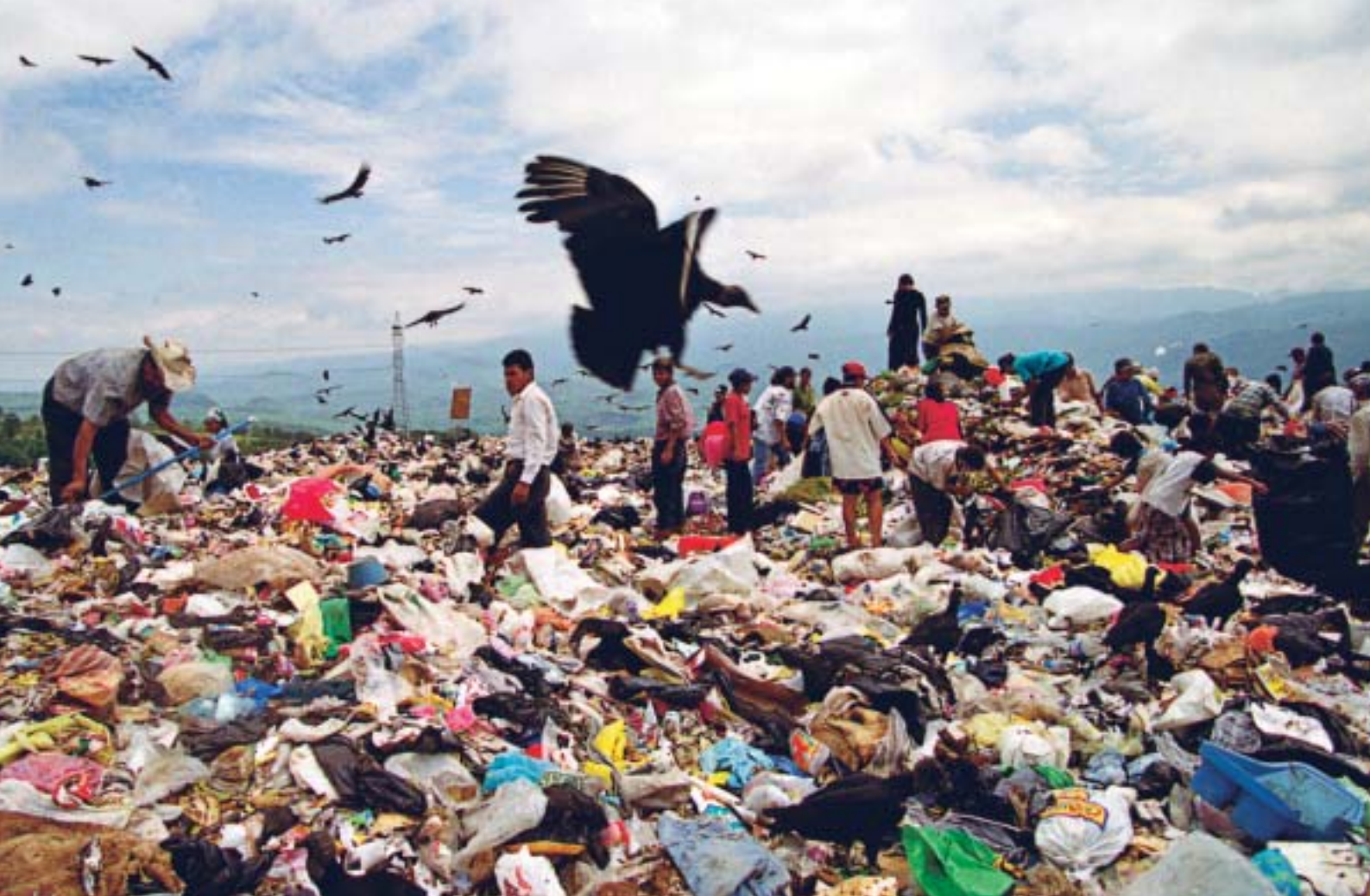
TEGUCIGALPAN KAATOPAIKKA, NICARAGUA.