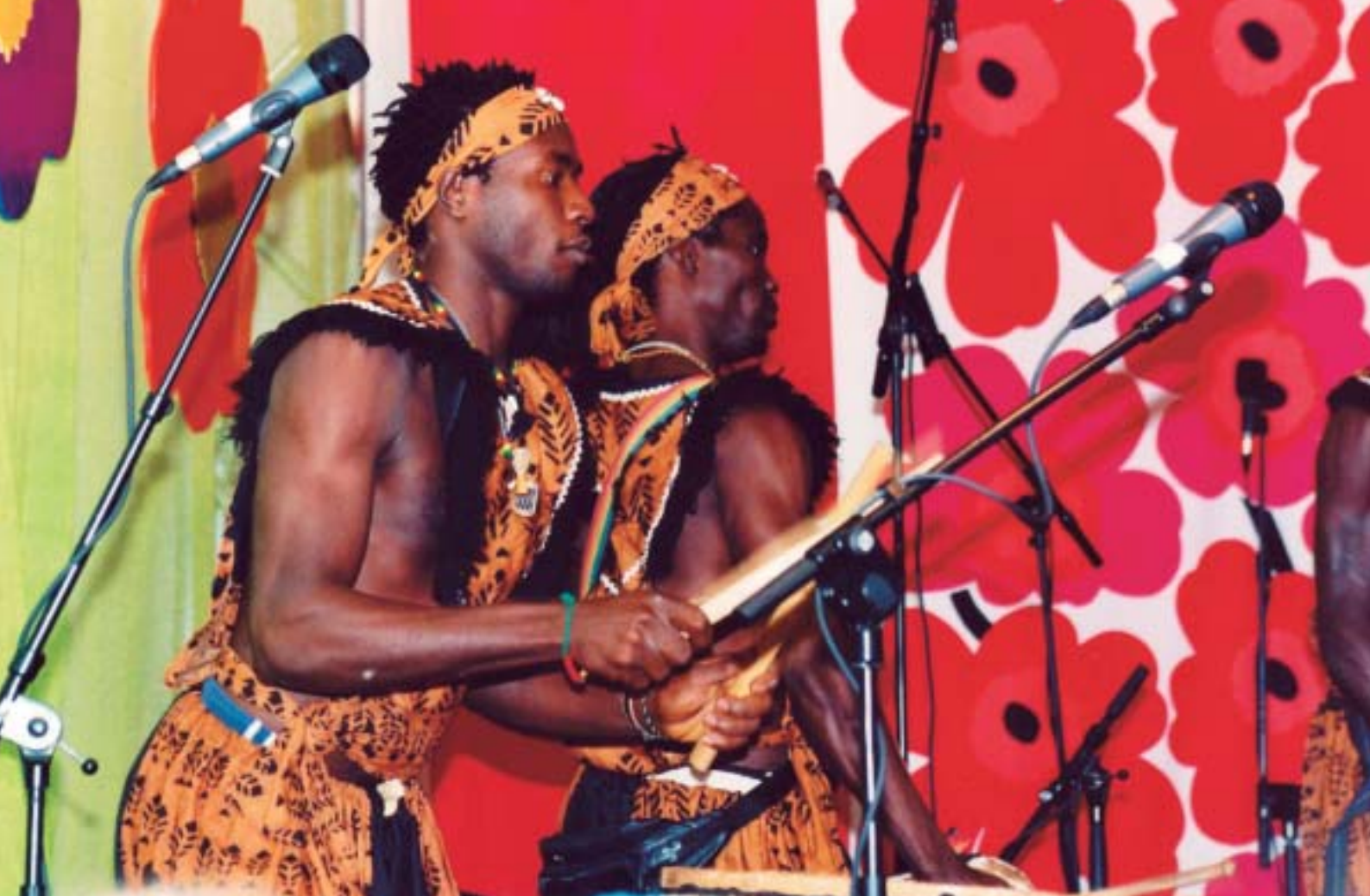
CAISA-LAVAN TUNNELMAA MAAILMA KYLÄSSÄ-FESTIVAALILLA 2003.