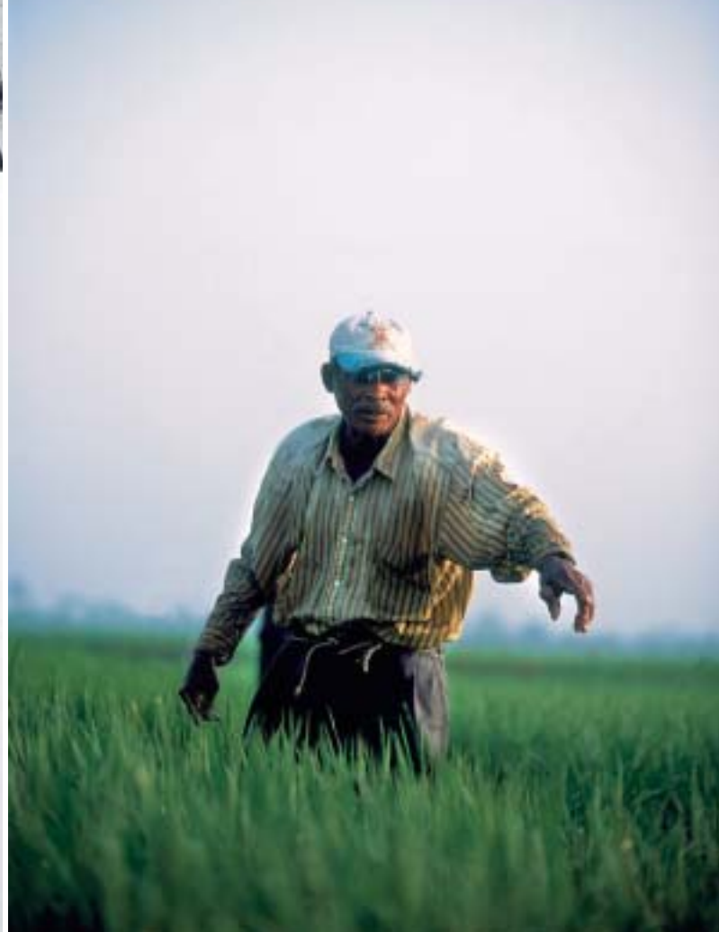
RIISINVILIELYÄ DOMINIKAANISESSA TASAVALLASSA.