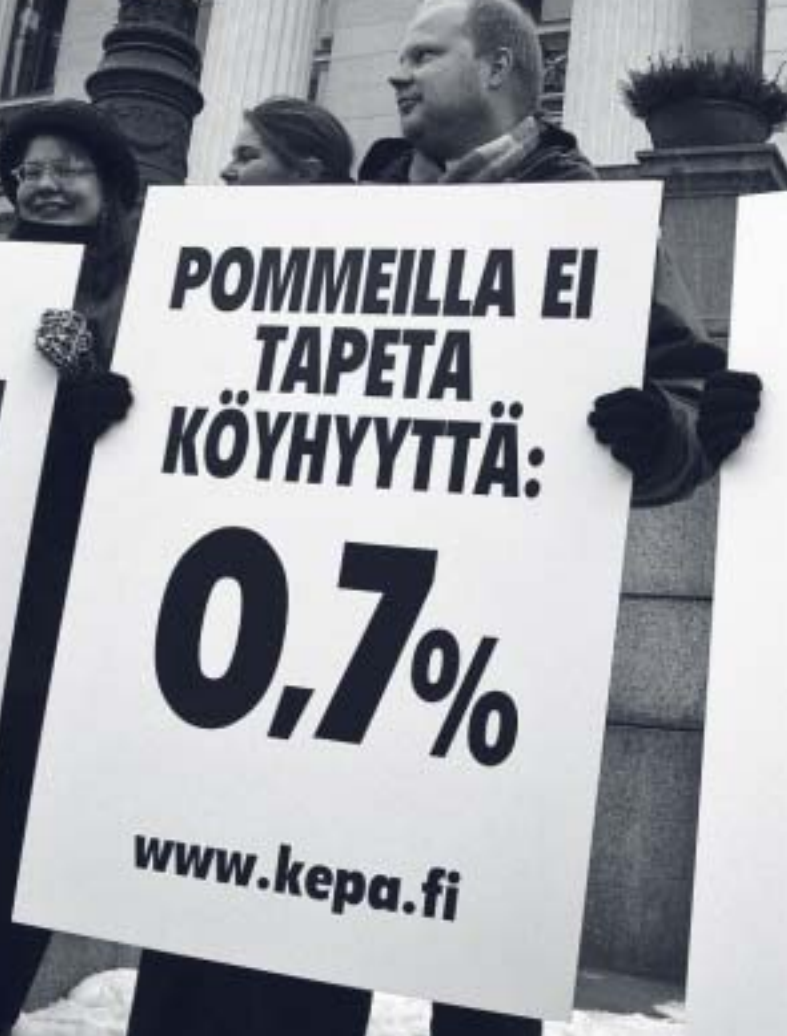
MIELLENILMAUS KEHITYSAVUN PUOLESTA VAALIEN ALLA 2003.