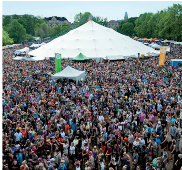
Maailma kylässä -festivaalin yleisöennätys, 105 000 kävijää, vuodelta 2012.